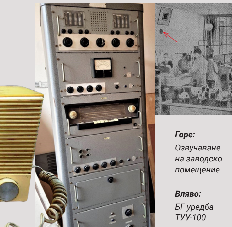
Горе: Озвучаване на заводско помещение

Радиоцентралата е наричана още трансляционна усилвателна уредба или радиоусилвателна уредба. Тези устройства се планират според това какви помещения и площи ще се озвучават. След като се определят видът, броят и мощността на високоговорителите, се предвиждат усилвателни стъпала с нужната за точките мощност, като се оставя и известен резерв. Съобщение до абонатите може да се направи по микрофона, музика ще се пусне по грамофона, а някоя радиостанция ще се препредава чрез вградения в уредбата радиоприемник.