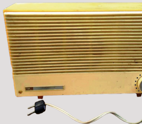
Култовата радиоточка Тонмайстор

Има няколко причини да се разпространи бързо този начин на радиопредаване. Напр. отпада нуждата от закупуване на скъп радиоприемник, който може да стане още по-скъп заради повреди на дефицитни части в него. Жичната радиофикация се оказва удобна, когато властта започва да търси начин да разпространява радиопредавания в селища, където хората нямат радиоприемници или едва току-що е прекарано електричество. А радиоточките изразходват незначителна част ел. енергия от радиоцентралата. Предаването на сигнала от нея е много чисто, защото липсват атмосферни и други смущения. А когато централата препредава към точките някоя национална станция напр., качеството на звука също е много високо, защото уредбата разполага с почувствителен приемник, антена и т.н.